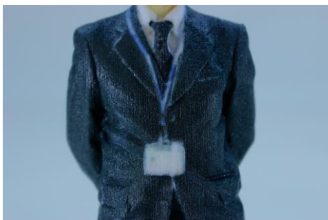
ハンディスキャナ+ゲーム機用スキャナでの造形例