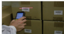
ハンディーターミナルによる検品