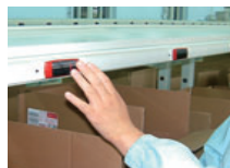
デジタルピッキング デジタルアソート